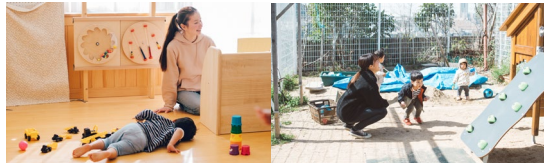
木のあたたかさ に包まれた 園庭のある保育園